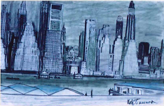
田村孝之介《ニューヨーク》 1962年頃 マーカー、パステル・紙 32.8×50.5cm (北野ホワイトハウス・コレクション)