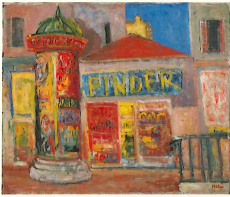
久本弘一《巴里 広告塔のある風景》 1936年 油彩・キャンパス 60.5×72.5cm