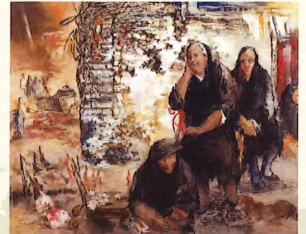
長尾和《紀行・ボルトガル》 2001年 油彩・キャンパス 182.0×227.5cm

2020年からのコロナ禍により、世界中で人々の移動の自由が制限されています。私たちが再び、さまざまな国への旅ができるようになるまで、絵の中で海外旅行気分を味わいませんか？ 全室、外国の風景に絞った特集展示です。