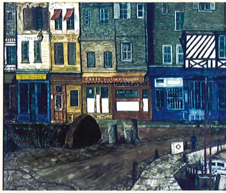
坂本益夫《ノルマンディー海岸 オンフルール港》 年不詳 油彩・キャンパス 60.7×72.7cm