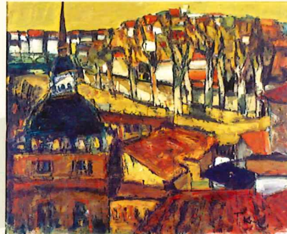
角卓《丘陵の街(スペイン)》 1964年 油彩・キャンパス 130.5×162.2cm