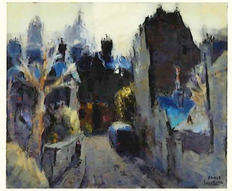
菅原流人《早春モンマルトル(パリ)》 1970年代 油彩・キャンパス 60.6×72.8cm