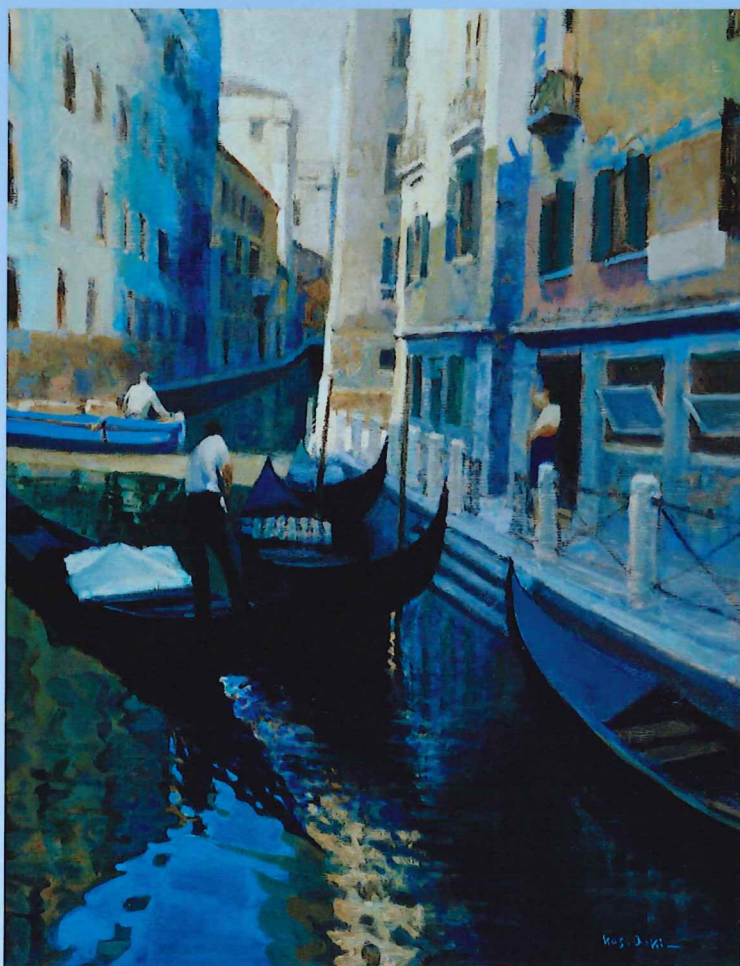
青木一夫《ベニス》 1971年頃