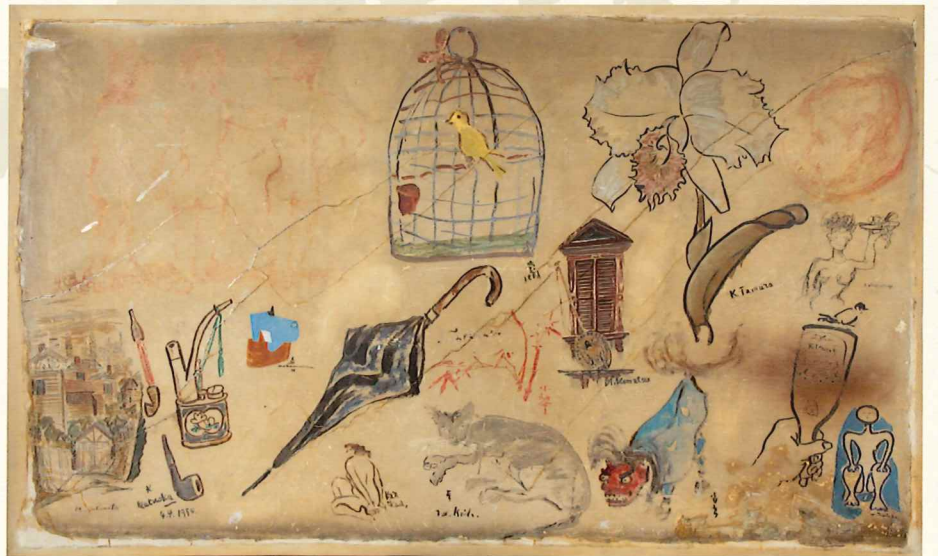
《アカデミー・バー壁画》 1950年前後 顔料・漆喰 108×185cm