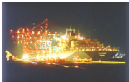
コンテナターミナル（夜間荷役）