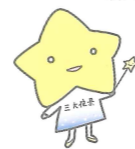
星のこども ほっしー