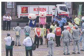
クリーン作戦(六甲道周辺)