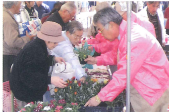
なだ桜まつりでの緑化・飾花推進活動