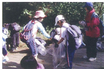
摩耶山クリーンハイキング