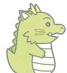
まや山のドラゴン

摩耶山の伝説をもとにしたキャラクターが生まれました。このキャラクターがデザインされたバッジは、まやロープウェー星の駅にある懐かしい「ガチャガチャ」(カプセル販売機)で4月から販売します。