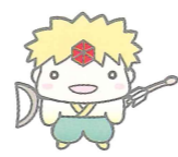
てんぐ族のこども しゅげんくん