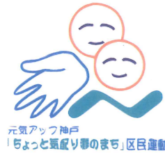
「ちょっと気配り灘のまち」シンボルマーク

灘区は平成7年の阪神・淡路大震災で大きな被害を受けましたが、復興の過程でまちの中に大量に捨てられるゴミや、違法駐車などが目につくようになっていきました。自分勝手にふるまうのではなく「ちょっとした気配りで住みやすい街になるはず」ということで、平成9年に「ちょっと気配り灘のまち」区民運動が始まりました。現在では、クリーン作戦やクリーンハイキング、花や緑で街を彩る、緑化・飾花などの推進活動にも広がっています。ちょっと気配り運動が始まって15年、新しく灘区に住む人も増えています。これからも住みたい、住み続けたいと思えるような灘区にするために「ちょっと気配り」を考えてみませんか？