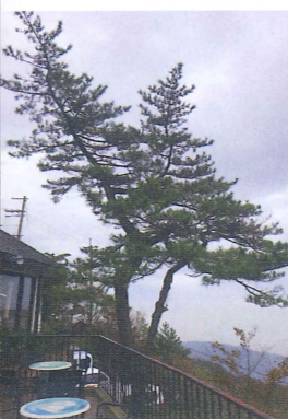
六甲ケーブル 山上駅展望台