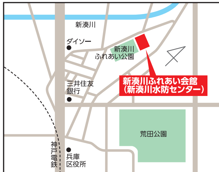
新湊川ふれあい会館(新湊川水防センター) 【兵庫区東山町1-9-20】