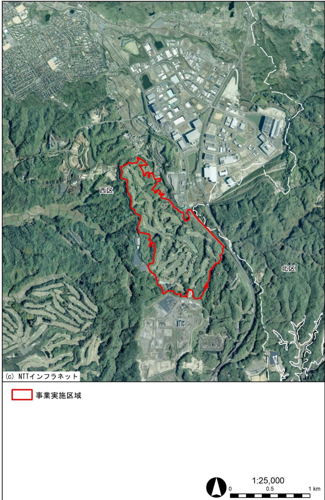
図 事業実施区域及びその周囲の現況

【参考資料】(仮称)西神戸ゴルフ場を転活用した産業団地整備事業 環境影響評価事前配慮書 (令和3年7月、神戸市)より抜粋