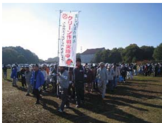
地域主体のクリーン作戦

地域活動としてクリーン作戦を実施し、暮らしに身近な地域の美化に努めます。住民主体の美化活動については、ごみの出し方・マナーの周知を図るほか、資材の提供などを通して活動を支援します。