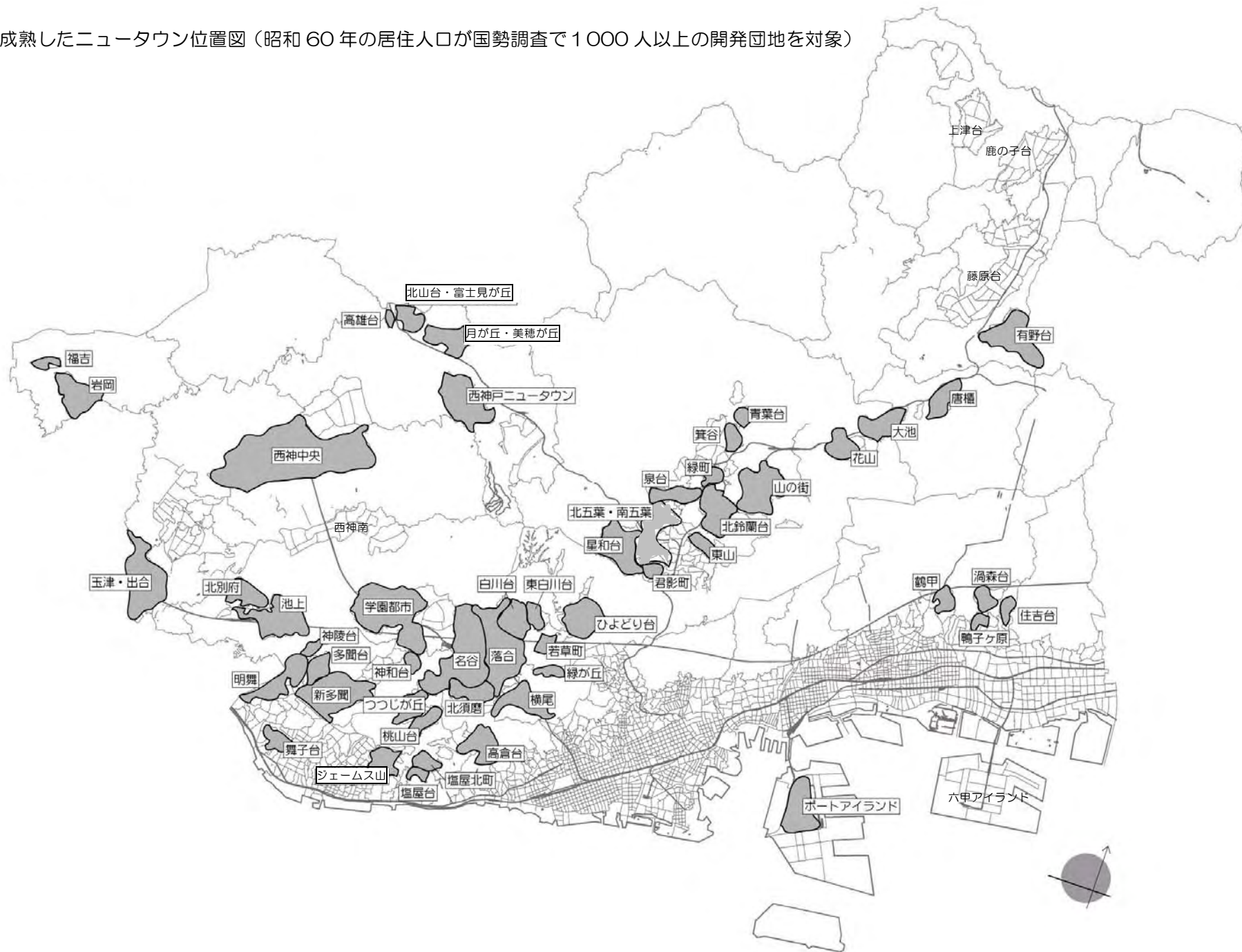
成熟したニュータウン位置図（昭和 60 年の居住人口が国勢調査で 1 000 人以上の開発団地を対象）